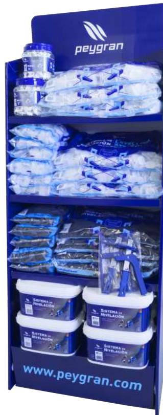
Gondole CARTÓN (65x162x40cm)