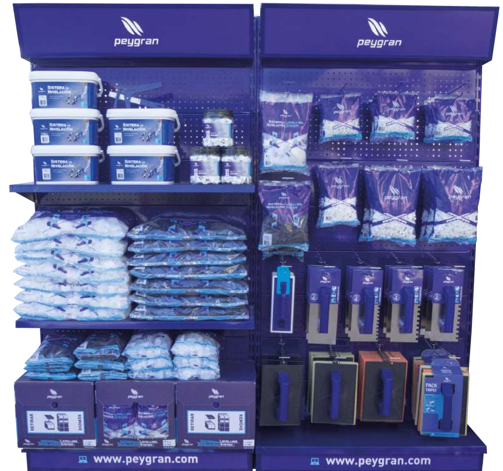
Gondole PLUS, PERSONNALISABLE (200x200x40cm). Consultez les conditions.