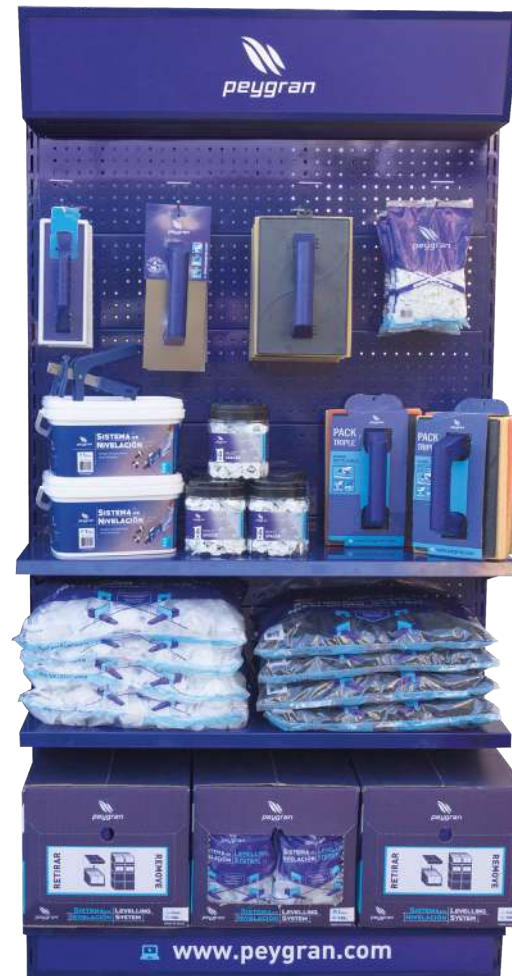
SIMPLE Gondole (200x100x40cm)